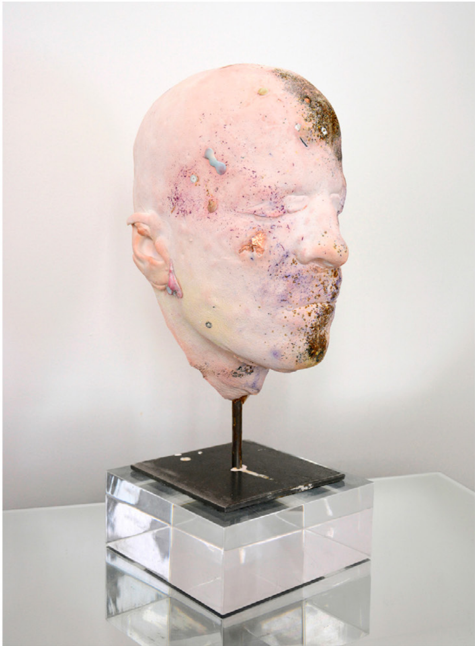
Tirésias plâtre synthétique, débris d'atelier, pigments, métal, plexiglas 40 x 20 x 20 - 2018 Prix: 2200 €