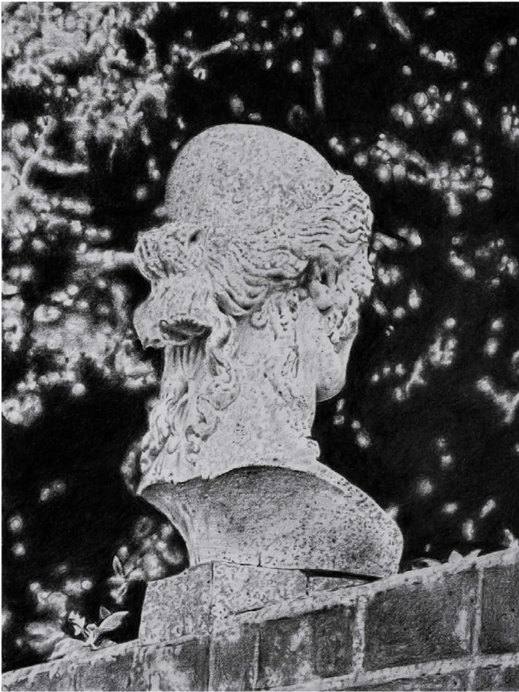
Jinny graphite Pitt sur papier, encadré verre musée baguette noire dessin 18 x 28 cm - cadre 50 x 40 cm- 2024 Prix: 1600 €