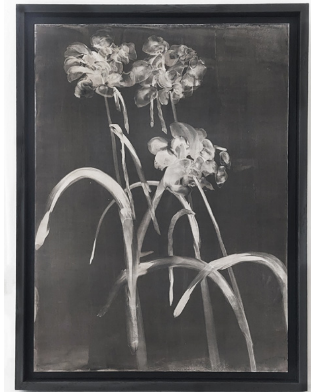
Herbier Dessin sous autohypnose fusain sur papier de pierre 42 x 30 cm - 2021-2024 Prix: 1400 € chacun