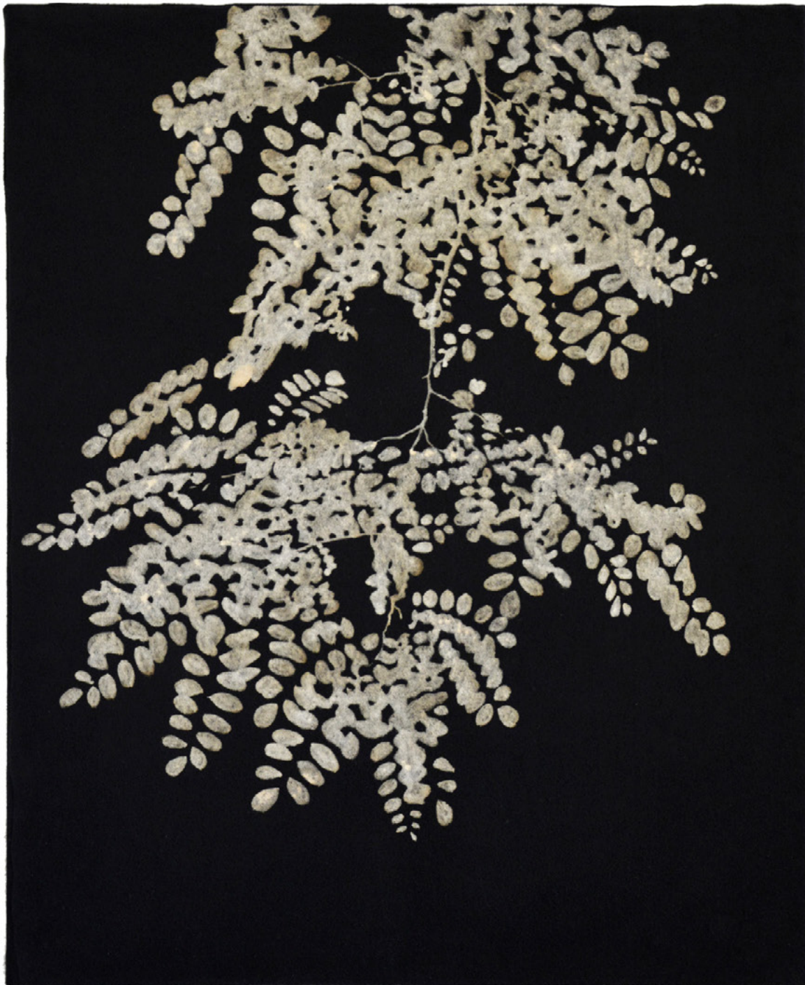
The garden of shadows (Robinier faux acacia) eau de javel sur feutre de coton monté sur châssis bois 90 x 73 cm - 2023 Prix: 2600 €