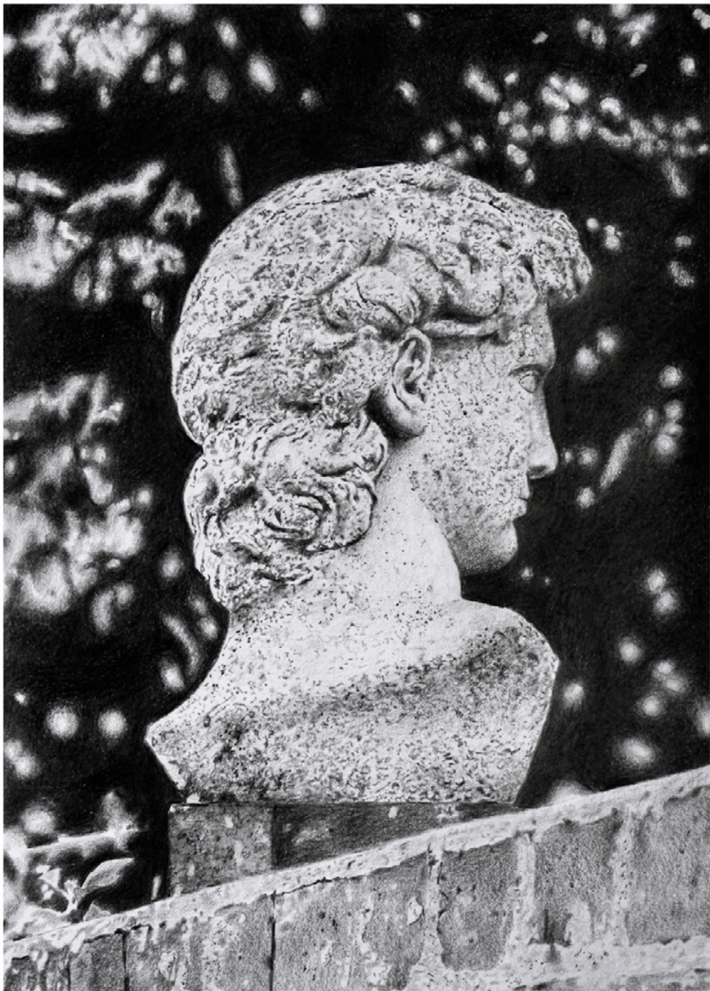
Perceval graphite Pitt sur papier, encadré verre musée baguette noire dessin 18 x 28 cm - cadre 50 x 40 cm- 2024 Prix: 1600 €